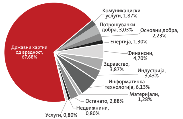
Секторска структура на портфолиото на Триглав отворен задолжителен пензиски фонд-Скопје