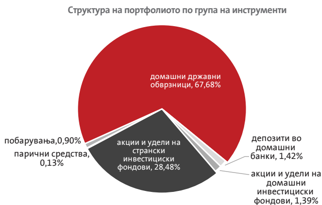
Структура на портфолиото на Триглав отворен задолжителен пензиски фонд – Скопје по групи на инструменти