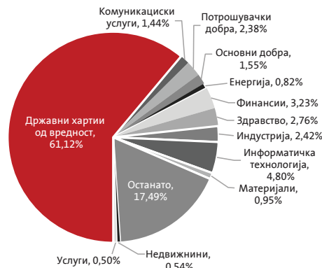
Секторска структура на портфолиото на Триглав отворен доброволен пензиски фонд-Скопје

Нето вредноста на средствата на доброволниот пензиски фонд на 31.12.2023 година изнесуваа 10,65 милиони денари.*