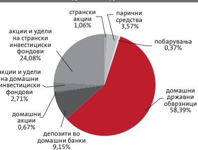
Структура на портфолиото на Триглав отворен задолжителен пензиски фонд - Скопје по групи на инструменти