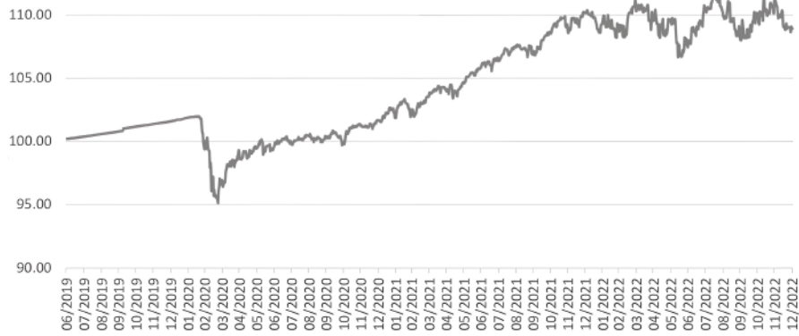
*Вредност на сметководствена единица