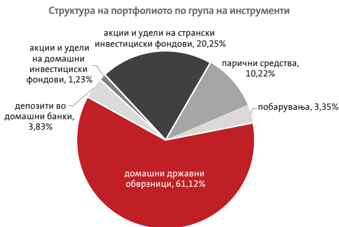
Структура на портфолиото на Триглав отворен доброволен пензиски фонд – Скопје по група на инструменти